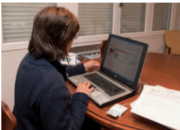
La mayor reducción de cargas está muy relacionada con la presentación vía telemática de solicitudes y documentación