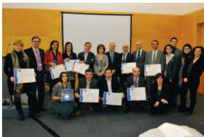
Representantes de los proyectos premiados y de los nuevos destinos adheridos al Sistema SICTED.