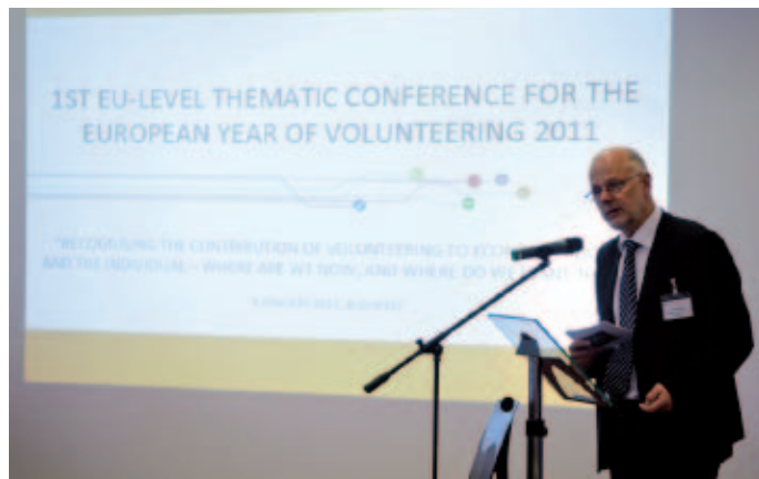
El Presidente del Consejo Económico y Social Europeo, Staffan Nilsson, en la presentación del Año Europeo del Voluntariado, en Budapest.