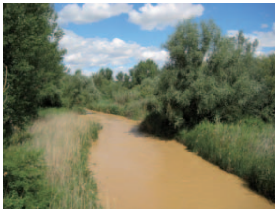
Río Flumen, en la Comarca de Los Monegros, donde se trabaja en restauración de sistemas acuáticos.

Como objetivos específicos, la Diputación se plantea demostrar la viabilidad de crear un "sistema de control integrado para reducir al mínimo los riesgos ambientales" sobre la base de una red de sensores meteorológicos situados en los viñedos, con el fin de reducir el uso de productos químicos a lo estrictamente necesario; pretende mostrar también que utilizando una cantidad limitada de productos químicos es posible ser más productivos y mejorar la calidad. Al tiempo, se busca hacer de esa reducción de tratamientos químicos en los viñedos un valor añadido para las bodegas y la comunidad. Los resultados esperados pasan