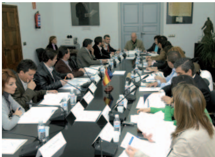
Comisión de Participación Ciudadana y Gobernanza de la FEMP.

Finalmente, el proceso culmina con la difusión de los resultados a través de los diferentes canales y soportes, el seguimiento participado a través de Comisiones Ciudadanas de Seguimiento y la rendición de cuentas o devolución del nivel de ejecución (identificación / señalización de las propuestas ejecutadas, página web, publicación, órganos municipales de participación...). ★