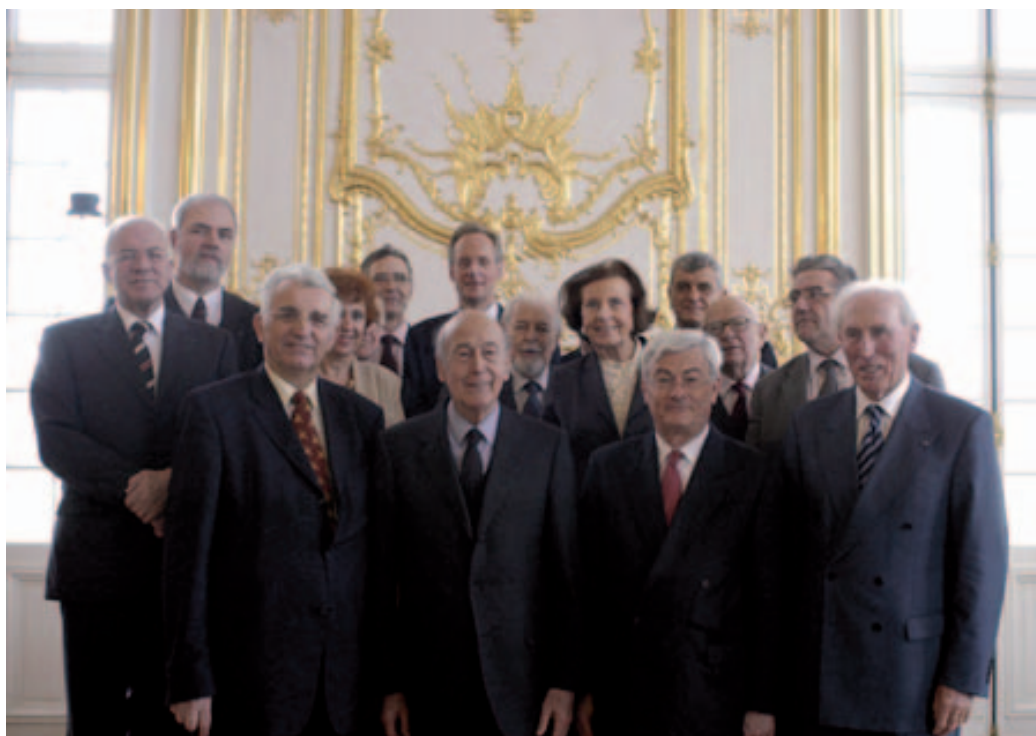
Antiguos y nuevos personajes del CMRE en el año 2004, en Versalles, durante la celebración de un seminario.

El 28 de enero de 1951 la ciudad suiza de Ginebra acogía el nacimiento de una nueva asociación municipalista europea, el Consejo de Municipios de Europa, el futuro CMRE. El pasado 28 de enero, la misma ciudad volvía a ser anfitriona, pero esta vez de la apertura de las celebraciones del sexagésimo aniversario de esa organización. Ahora, un movimiento más grande, más fuerte y más europeo, el actual CMRE, celebrará a lo largo de estos meses su apuesta por la democracia local y regional; en diciembre, llegará el balance.