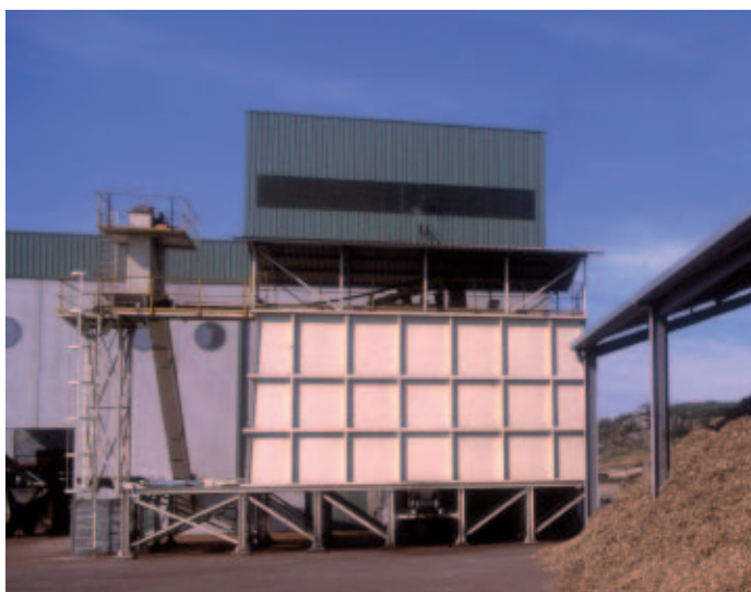
El Manual dedica un apartado especial al estudio a la tramitación de licencias ambientales.

En definitiva, todas las propuestas enunciadas en este estudio, tanto de eliminación de documentación, como de creación de una nueva licencia, etc., repercuten en una disminución de cargas y, por tanto, en un ahorro directo para el ciudadano, así como en un ahorro indirecto al acortarse los plazos de tramitación ★