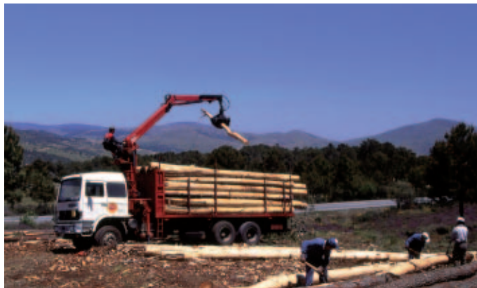
España aprovecha poco su potencial forestal. La producción sostenible estimada podría alcanzar los 50 millones de metros cúbicos de madera.

Los Bosques Modelo funcionan combinando las necesidades sociales, culturales y económicas de las comunidades locales con la sostenibilidad a largo plazo. Sus actividades enlazan la silvicultura, investigación, agricultura, minería, actividades recreativas y otros valores. Todo ello forma la base del trabajo en red, el aprendizaje y la innovación desde el nivel local al global ★