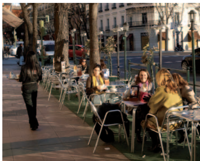
El texto facilita los trámites para la instalación de terrazas en la calle.

El Ayuntamiento de Madrid ha aprobado inicialmente la Ordenanza omnibus en la que se recogen las modificaciones normativas de la ciudad para adaptarlas a la Directiva Europea de Servicios en el Mercado Interior. Se verán afectadas más de una veintena de ordenanzas y varios reglamentos y normas municipales, una vez que sea aprobada de forma definitiva probablemente en el mes de marzo