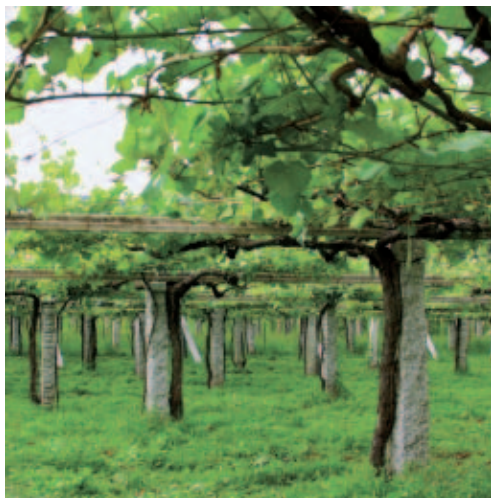
Viñedos de Albariño, en las Rías Baixas.

ambientales. Entre los resultados esperados, el Ayuntamiento contempla la valorización de los bosques de Enguera, a través de una gestión más eficaz de todos sus recursos; la mitigación del cambio climático mediante la reducción de las emisiones de CO 2 por el uso de la biomasa forestal; la reducción del riesgo de incendios forestales en la zona del proyecto, y, finalmente, la elaboración de un documento oficial de Enguera sobre los nuevos criterios para manejar los bosques mediante el uso de biomasa residual como fuente de energía limpia.