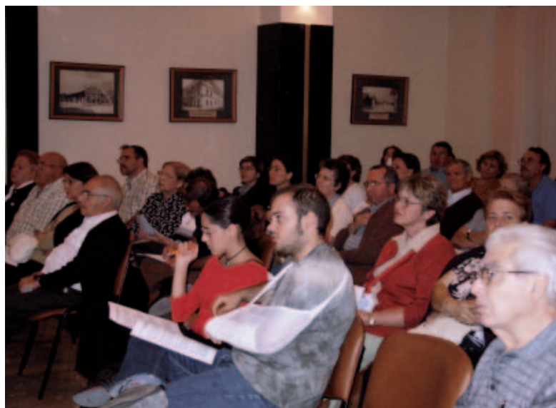
Es necesaria la incorporación en el proceso de todos los sectores de la ciudadanía, incluidos los jóvenes.

Un grupo de técnicos de la FEMP ha terminado recientemente la elaboración de una Guía para que los equipos de gobierno de los Ayuntamientos faciliten la participación activa y directa de los ciudadanos en el proceso de elaboración de sus presupuestos. Se trata de un instrumento en expansión para profundizar en la democracia participativa y, precisamente por esto, pretende facilitar la puesta en marcha de este proceso en aquellos municipios que aún no hayan iniciado esta vía de participación ciudadana y deseen hacerlo.