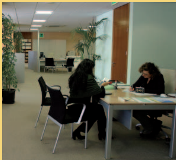
El Plan PICAS de Catarroja supone un ahorro de más de 600.000 euros anuales

El Plan PICAS propone el despliegue de varias líneas de actuación como metodología de trabajo y su aplicación supondrá un ahorro directo e indirecto y un valor que asciende a la cantidad estimada de 664.530 euros anuales, con un año de antelación a las expectativas europeas y nacionales.