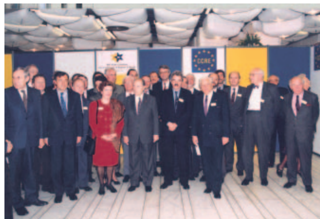
Estrasburgo 1994: Pascual Maragall, Presidente del CMRE, y François Mitterrand, Presidente de la República Francesa, en el centro, tras la celebración de los XIX Estados Generales del CMRE.