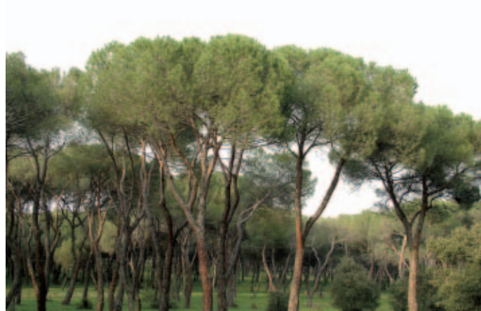
La superficie arbolada ocupa casi el 30% del territorio español.

De las muchas tareas que hay acometer para preservar la riqueza forestal española, los municipios son responsables de una parte importante y ofrecen a día de hoy algunas muestras representativas del camino a seguir. La propia Red de Gobiernos Locales por la Biodiversidad de la FEMP incluye entre sus principales objetivos la promoción de actividades desde los municipios en-