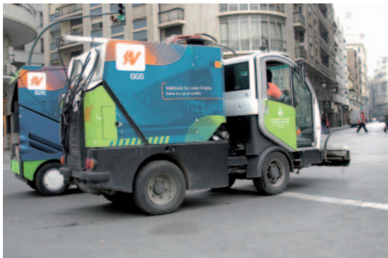
La Ejecutiva pide que se aclare la actual confusión sobre la aplicación de tasas o precios públicos en la retribución de servicios.

Por este motivo, y tras estudiar la situación, la FEMP considera necesario, y así lo ha trasladado a los Grupos Parlamentarios del Senado, aclarar la regulación vigente.