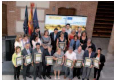
Ganadores del Concurso del pasado año.

La Fundación Biodiversidad acaba de lanzar el concurso "Capital de la Biodiversidad", cuyo objetivo es aumentar la protección de la naturaleza en los municipios españoles fomentando las iniciativas que los Ayuntamientos dirijan a la conservación de la biodiversidad.