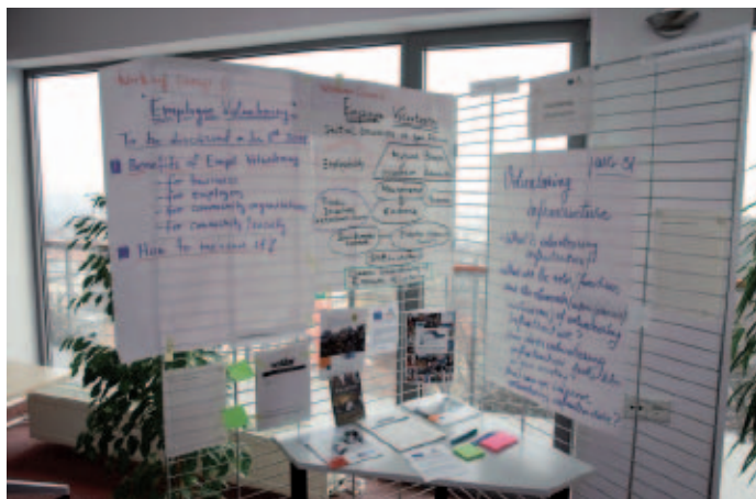
Aportaciones de uno de los grupos de trabajo al Año Europeo del Voluntariado.

Según señala el estudio, es fundamental realizar una clarificación del régimen jurídico de los voluntarios porque así se podrá contribuir a abordar otras cuestiones clave, como la inmigración y la residencia en el país de acogida, la fiscalidad y el régimen de seguridad social de los voluntarios a tiempo completo ★