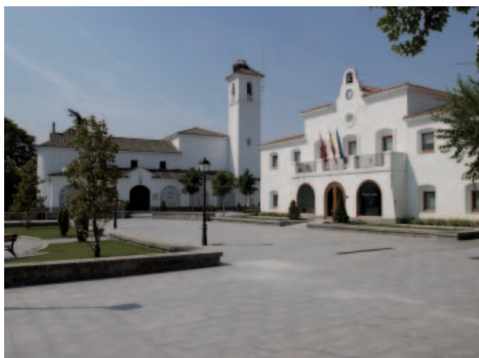
Villanueva de la Cañada es uno de los municipios que participan en el proyecto piloto.

de fuentes de datos que evite la presentación de certificados, documentos o datos que ya obren en poder de la Administración, en particular a través de los registros.