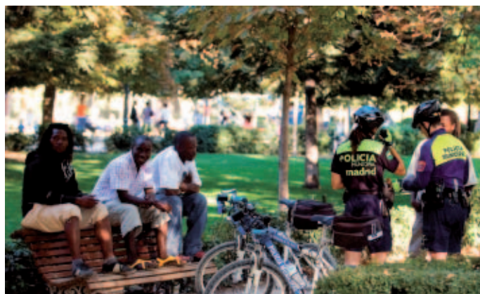
La FEMP formará parte de la Plataforma por la Gestión Policial de la Diversidad, creada para garantizar un trato policial igualitario a los colectivos minoritarios.

La Ejecutiva también dio el visto bueno al contenido de otro convenio, con la Asociación REDTEL, para el despliegue de las infraestructuras de redes de telefonía móvil y, en concreto, para dar continuidad en 2011 al funcionamiento y mantenimiento del Sistema de Asesoramiento Técnico e Información (SATI), que depende de la FEMP ★