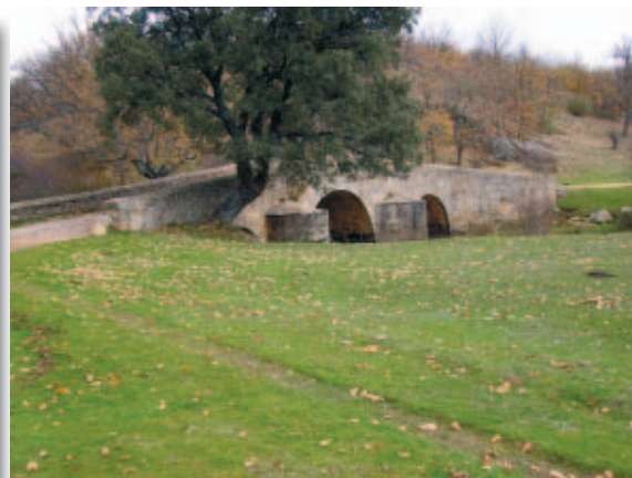
Parajes de Valonsadero y San Saturio, en Soria, donde se trabaja en el Corredor Urbano Medioambiental CO2Cero.