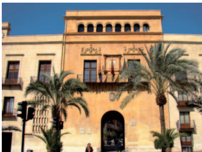
La experiencia de Elche también ha quedado reflejada en el Manual.

Del mismo modo, aconseja que se proporcione información adicional o sistemas de ayuda para facilitar el cumplimiento de las cargas administrativas impuestas, tales como los canales de empresa o guías de ayuda; la divulgación de las cargas administrativas que se modifican o suprimen; el acceso fácil, por vía Web, a toda la tramitación de un procedimiento y a la cumplimentación, el envío, la notificación y el pago de tasas e impuestos por vía electrónica; y la simplificación y unificación del lenguaje administrativo, facilitando la comprensión, cumplimentación y tramitación de documentos.