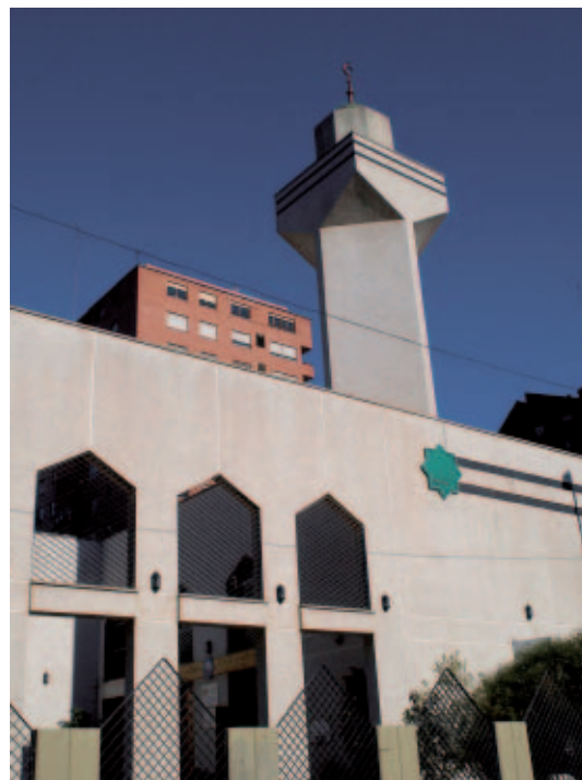
La FEMP elabora un Manual para la gestión municipal de la diversidad religiosa.