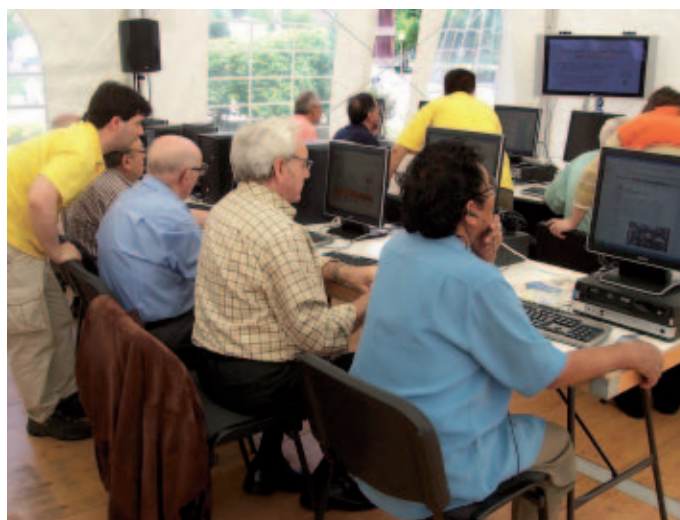
Durante el último año ha aumentado el número de personas de entre 45 y 65 años que se han incorporado al uso de las TI.

Esta situación de la e-Administración, que aparece detallada en la publicación "La Sociedad de la Información en España 2010" (Fundación Telefónica), es una de las diez claves que marcaron el pasado año al sector de las TIC; la innovación como medio para salir de la crisis fue la primera de esas claves, en la que tanto empresas como Administración estuvieron implicados; las empresas, con un aumento de sus inversiones, y la Administración con estrategias como el Plan Avanza –y su continuación para estos años, el Plan Avanza2 2011-2015–.