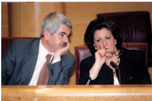
Pascual Maragall, Presidente del CMRE, y Rita Barbera, Presidenta de la FEMP, en el Senado en 1998

A lo largo de su historia, y entre otros logros, el CMRE ha colaborado de forma muy estrecha con el Congreso de Poderes Locales y Regionales de Europa (CPLRE, del Consejo de Europa); ha impulsado los hermanamientos entre municipios –una actividad nacida con el propio CMRE– para favorecer la idea de Europa entre los ciudadanos; ha facilitado la creación de un fondo europeo para apoyar la actividad de hermanamientos; ha impulsado la Carta Europea para la Igualdad de Hombres y Mujeres en la vida local; ha creado una Plataforma de Autoridades Locales Europeas para el Desarrollo (PLATFORMA); y ha jugado un papel determinante en el nacimiento de la Convención de Alcaldes, orientada a impulsar las energías limpias y la reducción de emisiones.