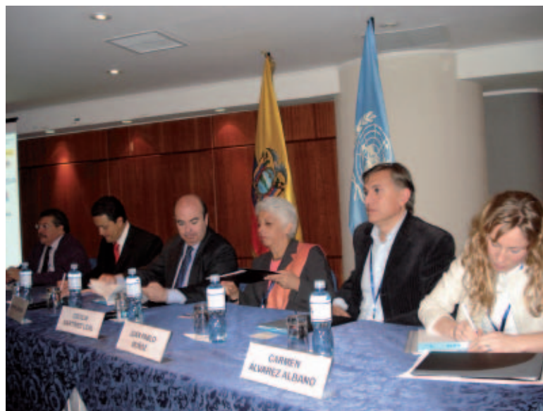
El acto de apertura contó con participantes españoles.